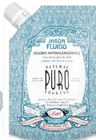
BIO SACHET JABÓN FLUIDO Cont. Neto 280g.