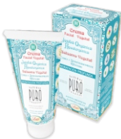
CREMA FACIAL Cont. Neto 60ml.