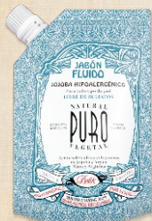
BIO SACHET JABÓN FLUIDO Cont. Neto 280g.